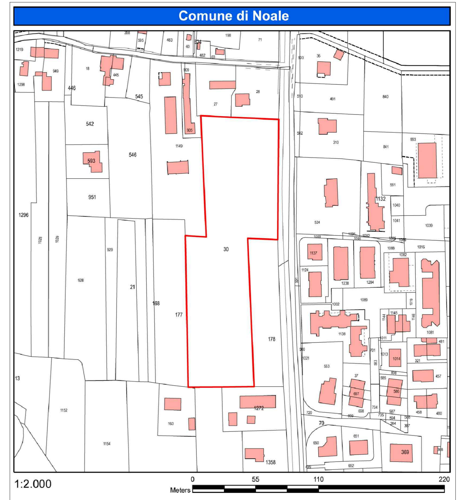
ESTRATTO MAPPA CATASTALE - scala 1:2000

DATI: localizzazione: Via Valsugana mappali oggetto di Variante: foglio 14 mapp. n. 30 classificazione vigente PRG: Z.T.O. E2 ed E4 scheda E4/009 - lotto intercluso n. 8 (mc 800)